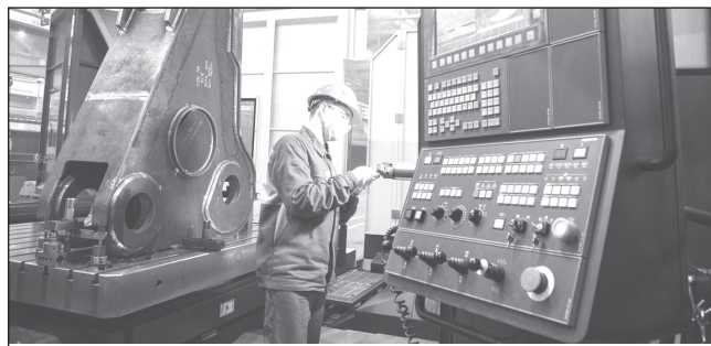
В планах завода — дальнейшее расширение производства.

приятию работают над еще одним инвестпроектом: готовится к запуску еще один цех площадью 16 тысяч кв.м. Отметим, в планах завода — дальнейшее расширение производства, которое позволит, в том числе, создать новые рабочие места.