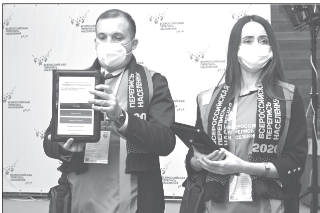
Штат переписчиков практически набран

Всероссийская перепись населения пройдет с 15 октября по 14 ноября 2021 года. В Ивановской области завершается подготовка к кампании.