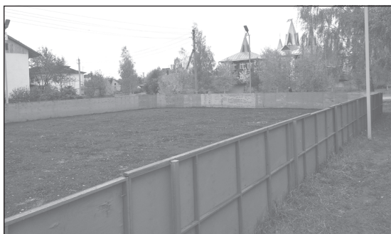
Часть работ уже выполнена

В рамках реализации программы развития спорта на селе продолжается работа по созданию роллердрома в с. Новое.