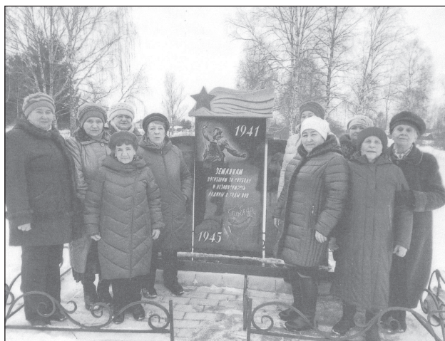
Февраль 2020 г. Члены клуба «Встреча» в Рождественском поселении

Впереди – новые планы, надеемся, что они осуществятся в связи с отменой режима безопасности, связанного с эпидемией, мы верим, что двери клуба снова откроются для встречи старых и новых друзей.