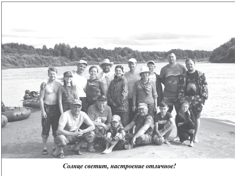
Солнце светит, настроение отличное!