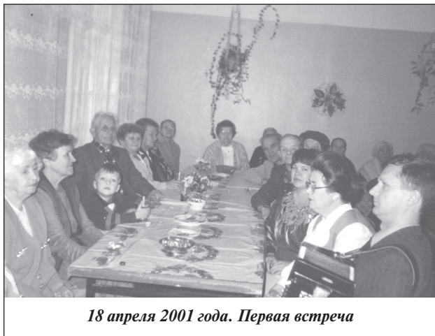
18 апреля 2001 года. Первая встреча