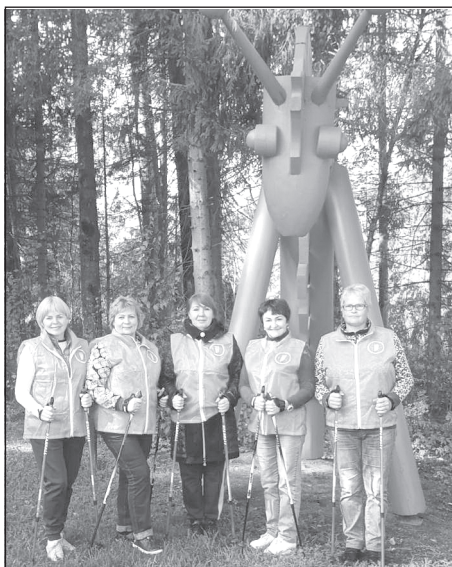
Ну разве это пожилые люди? Это женщины в расцвете лет и сил!

делю пожилые люди укрепляют своё здоровье, выполняя посильные упражнения на свежем воздухе. Их район занятий - ул. Лынянщиков. Но и за пределы своего района - на мастер-классы и даже соревнования - приволжские «скандинавы» тоже выезжают. Пример тому - это фото, сделанное в Решме в сентябре этого года.