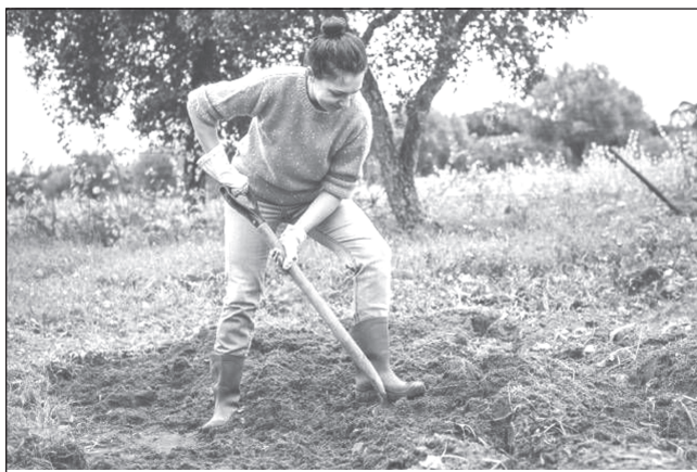
Перекопка земли осенью - важное дело

Как только собрали урожай, сразу же приступайте к перекопке почвы. Делают это вручную с помощью лопаты или специального культиватора. Выберите из почвы всё ненужное: крупные камни, строительный и другой мусор, растительные остатки, на поверхности которых остались возбудители инфекционных заболеваний. Иначе на следующий год все эти вредоносные патогены снова спровоцируют у рассады и растений точно такие же болезни. С помощью этой простой агротехнической операции вы потревожите, подняв на поверхность почвы, ушедших на зимовку личинок и куколок насекомых. Их тут же склюют птицы или съедят земноводные. Другой важный момент – почва после перекопки улучшит свою структуру, вы разобьёте корку, земля станет рыхлой, водо- и воздухопроницаемой, что положительно скажется на росте и развитии почвенных микроорганизмов. Они-то как раз и участвуют в формировании почвенного плодородия, их деятельность направлена на образование гумусовых веществ.