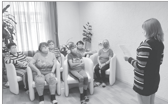
Сезон консервирования ещё не закончен

В процессе беседы поговорили и обсудили такие темы, как методы заготовок: сушка, заморозка и консервирование, включающее в себя маринование, квашение и засолку. После беседы, за чашкой чая, клиенты досугового клуба «ЗОЖ» между собой поделились рецептами вкусных блюд.