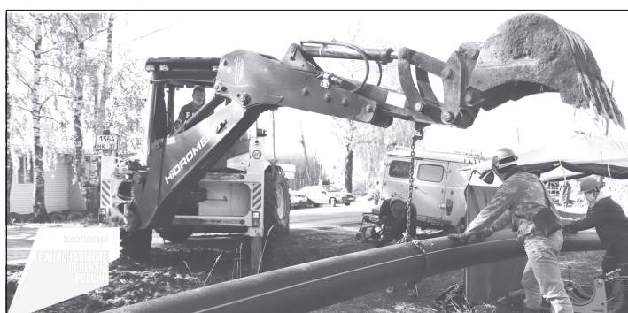
Работы по строительству объектов инженерной инфраструктуры начались