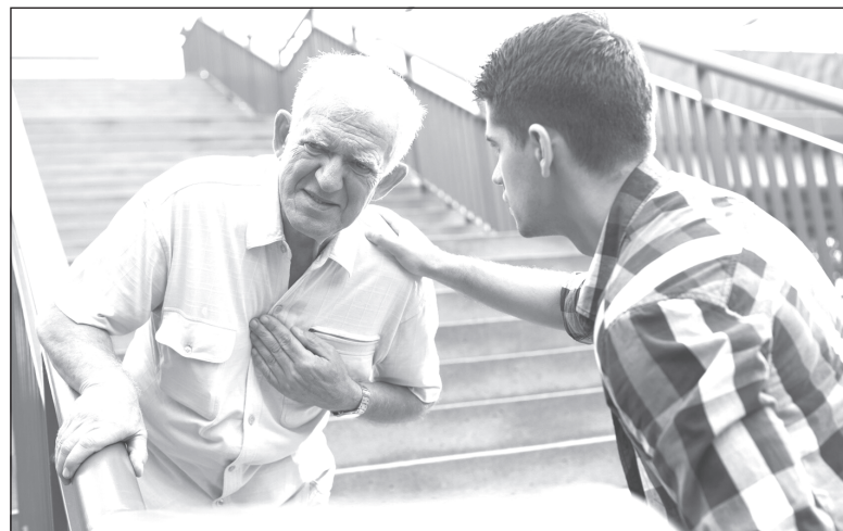
Если вы почувствовали боль за грудиной, чувство жжения, немедленно обратитесь к врачу

Одна из форм ИБС — стенокардия. В старину ее называли «грудной жабой». Это как раз те самые сжимающие боли в сердце при физической нагрузке (или одышка), о которых мы уже упоминали. В покое эти явления проходят, а еще они могут сниматься приемом нитроглицерина. Важно отметить, что боли в грудной клетке не всегда связаны со стенокардией, инфарктом и вообще с заболеваниями сердца. Это может быть, например, проявлением проблем с позвоночником. Поэтому важно обратиться к врачу, а не искать информацию в интернете, в книгах или расспра-