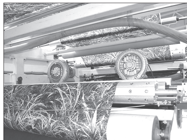
Благодаря займу ФРП «Фотопринт-Иваново» реализует инвестпроект по производству многослойных мембранных тканей.

от Фонда развития промышленности Ивановской области.