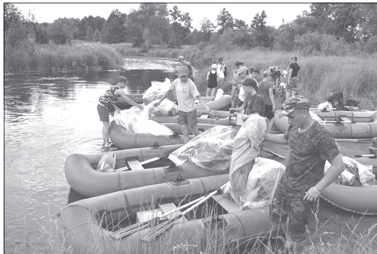
Добрались до стоянки

чик прикладывает руки к голове и разводит их в стороны.