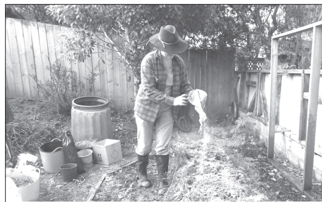
Внесение удобрений поможет восстановить плодородие почвы

Берегите себя и своих близких - пройдите вакцинацию!